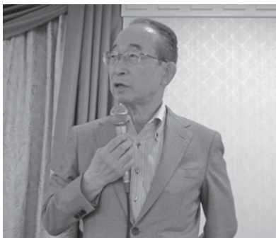
挨拶を述べる青山会長

5月17日、都農業会議は、72人の会員の出席を得て、事業推進協議会を開きました。協議では、平成29年度に取り組む事業推進計画・予算などについて説明し、区市町村・農業委員会との連携をさらに強化していくことを確認しました。