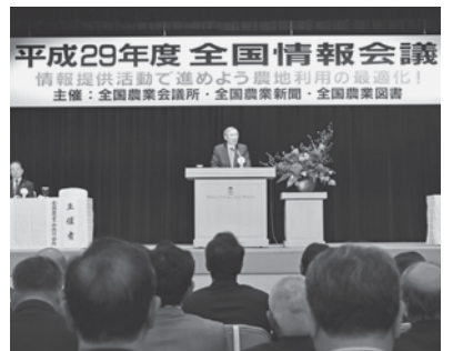
全国から農業者など約700人が集まった

東京都都市農政推進協議会（須藤正敏会長）は5月8日、南新宿ビルにおいて第50回通常総会を開きました。都市緑地法等をめぐる動きを受け、事業計画には生産緑