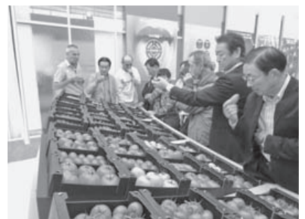
参加者は生産された様々な種類のトマトの特徴を熱心に聞いていた

アムステルダムから南西へ1時間、スリフラーフェラントの有機野菜生産農家セイネさん家族は1940年頃から3畝で有機農業を行っていません。多品目の野菜は自営レストランと店舗、100名ほどのもぎとり会員用に販売し経営は安定しています。有機農産物の生産には作目の選択と労力の安定が必要とのことでした。 施設園芸では、アルメーロバイテンのバラ生産農家を見学しました。気象災害の少ないオランダは温室の大規模化が可能で、電照によるロックウール周年栽培で年間10万本を生産し、アルスメール市場への出荷と直売で高収益を上げています。オランダは花を贈り物にする習慣があり、直売所には花束を求める人々が訪れていました。ロッテルダム近郊の大規模トマト生産経営は、6人の共同経営体で60種類を生産しています。ガラスハウスの高さは6メートル。コンピューター管理による雨水循環のロックウール栽培で、蜂による受粉と天敵を使った害虫防除など環境にやさしい栽培を徹底しています。