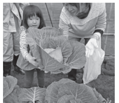
市内産の様々な野菜の収穫体験をした

質の良さが見て伝わる。ペラングで花と緑を楽しみたい」と様々な色合いを組み合わせて購入していました。