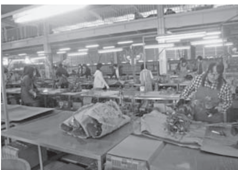
高知県産のグロリオサは世界に出荷されている

その後、会場を移し平成29年度全国優良経営体表彰・農林水産大臣賞表彰式が行われました。歓迎イベント、皇太子殿下のおことばに続き、8経営体が表彰を受けました。2日目には、高知市内の花