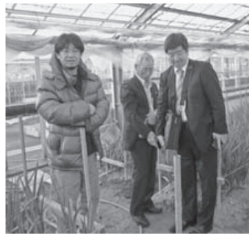
エアリーフロアの栽培を見学した

島しょ農業委員会協議会（中山慶孝会長）は、11月14日～15日に石川県でふるさと東京むらづくり塾と共催で「島しょ農業振興検討会」を開きました。